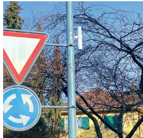
Zwei neu montierte «LORNO Communication Units» mit ihrer Antenne, welche vom unterirdischen Hydrophon gemeldete Unregelmässigkeiten weitergeben.

Hydrophon eine andere Intensität des Wasserströmungsverlaufs feststellt.